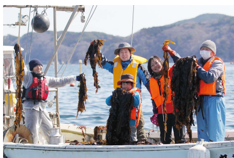
【船に乗り、ワカメを刈りとります】