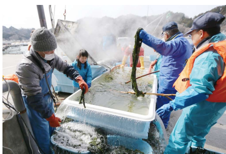
【塩蔵する前の湯通し作業】