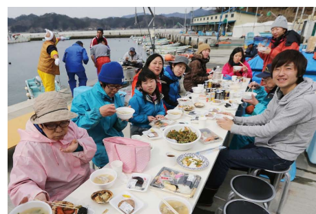
【みんなで食べるとおいしい!】